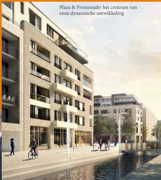
Plaza & Promenade: het centrum van onze dynamische ontwikkeling